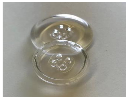
各パーツの造形に