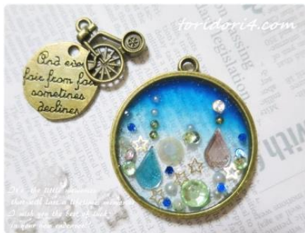
アクセサリ等の製作